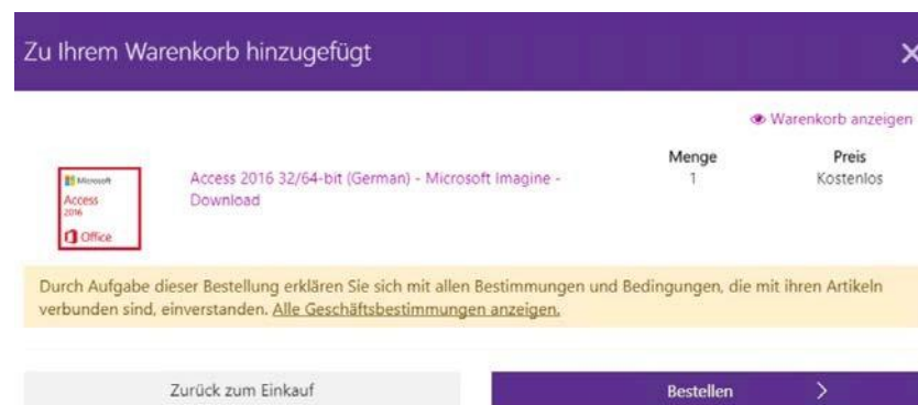
Abbildung 2: Warenkorb

Wählen Sie das gewünschte Produkt aus und legen Sie es in den Warenkorb. Sind Sie mit dem "Einkauf" fertig sind, müssen Sie im Warenkorb auf "Bestellen" klicken.